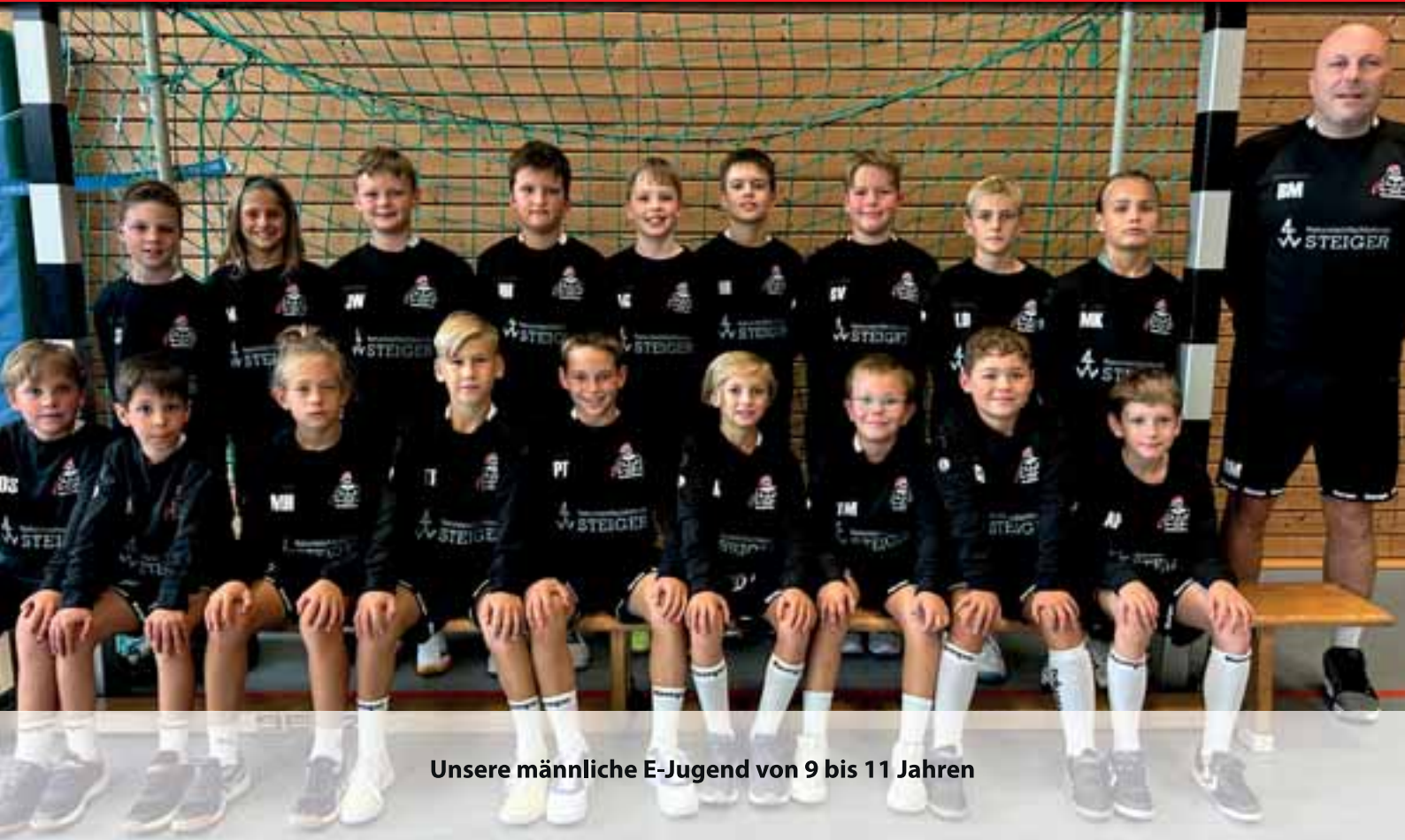
Unsere männliche E-Jugend von 9 bis 11 Jahren

Gerd Müller Großhandel Obst · Gemüse · Südfrüchte