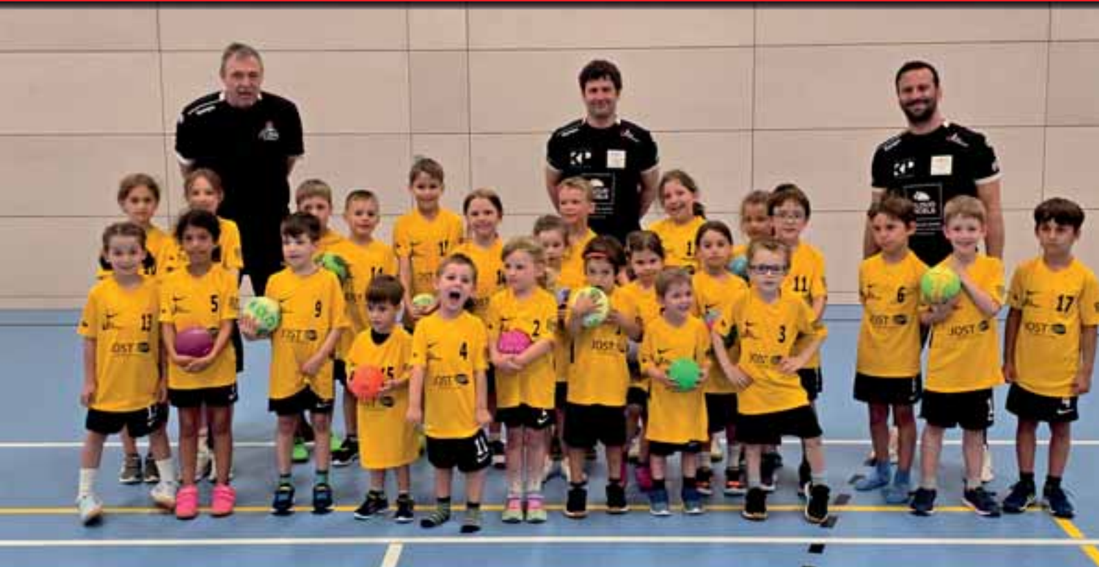
Unsere Minis von 5 bis 9 Jahren

Wir wünschen der HSG eine erfolgreiche Saison 2025/2026