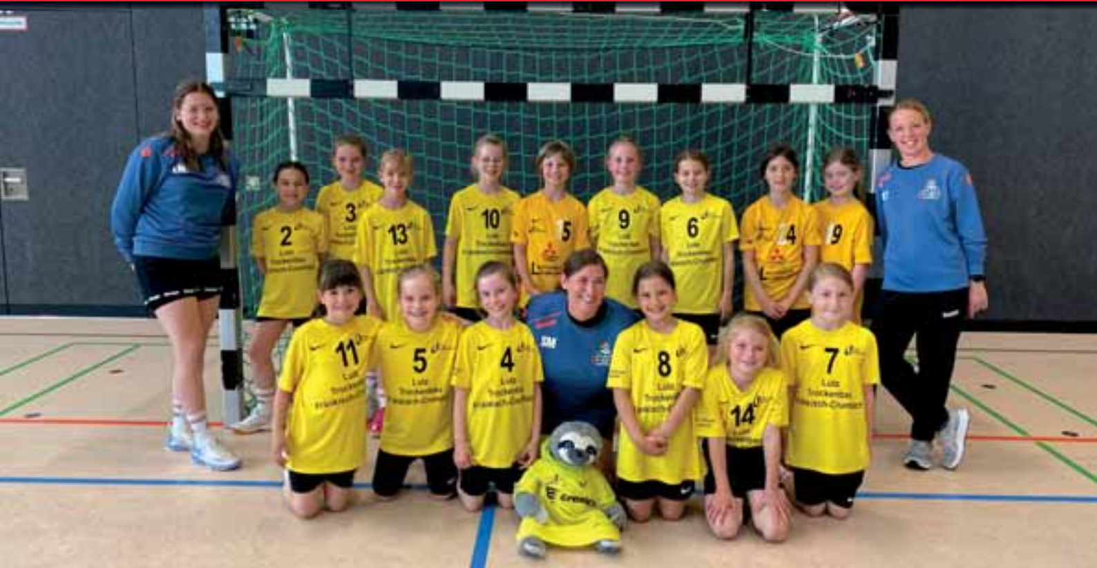
Unsere weibliche E-Jugend von 8 bis 11 Jahren